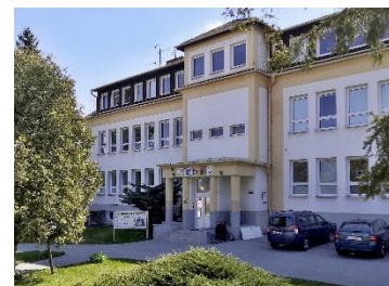
budova C Sokolovská 647/1

Výuka tělesné výchovy probíhá v Městské sportovní hale na ulici Komenského 596/4A a v tělocvičně Základní školy Komenského 609/6, případně v posilovně a herně stolního tenisu Domova mládeže na Sokolovské 647/1.