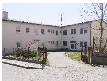
budova B Slunečná 173/2