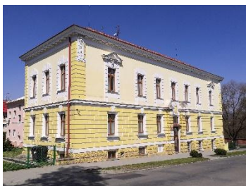
budova A Sokolovská 435/2

Teoretické vyučování oboru Podnikání probíhá ve městě Odry. V Odrách se vyučuje ve třech budovách na ulicích Sokolovská 647/1 a 435/2 a Slunečná 173/2. Teoretické předměty se vyučují v kmenových učebnách, které jsou vybaveny běžnou technikou (tabule, dataprojektory, notebooky s připojením na internet a ve vybraných učebnách interaktivní tabule), kapacita učeben je max. 34 žáků. Výuka informačních a komunikačních technologií probíhá v odborných učebnách ICT, kde mají žáci k dispozici osobní počítače s potřebným softwarovým vybavením a připojením k internetu. Kromě toho mohou ve výuce využívat multimediální a multifunkční učebnu pro přírodovědné vzdělávání, předměty specializace a výuku jazyků.