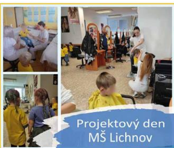
Projektový den MŠ Lichnov